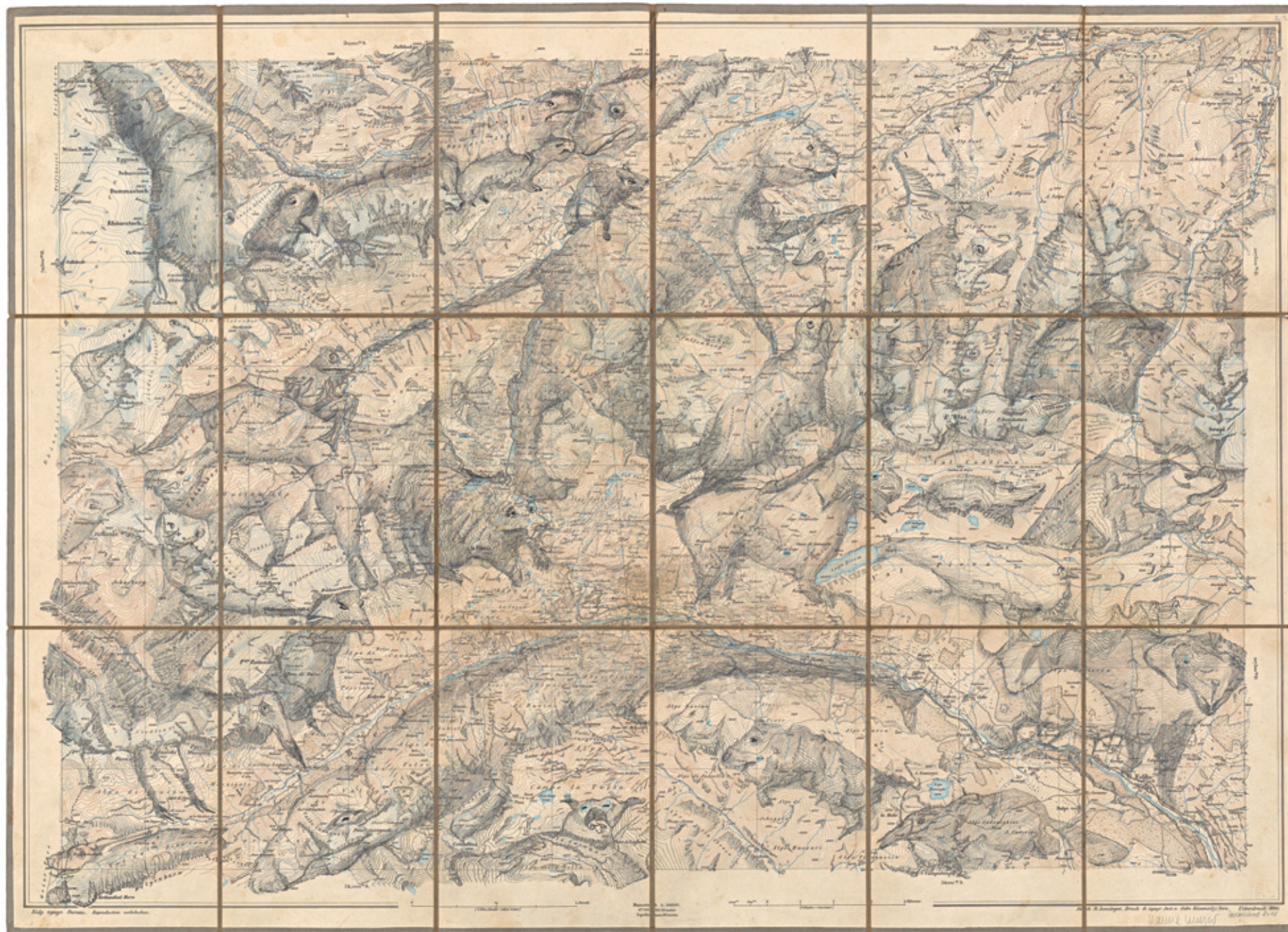
Aus der Serie Kartographische Geister und Tiere, Andermatt , 2015 Bleistift auf Landkarte, 55.7 × 77 cm