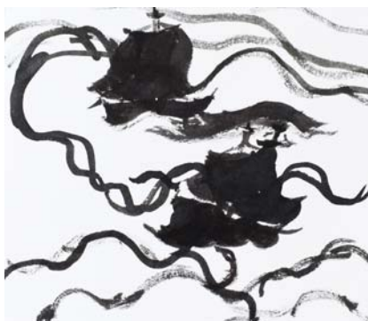
Ohne Titel , 2011/2012 Aquarell auf Papier, 19 x 22 cm