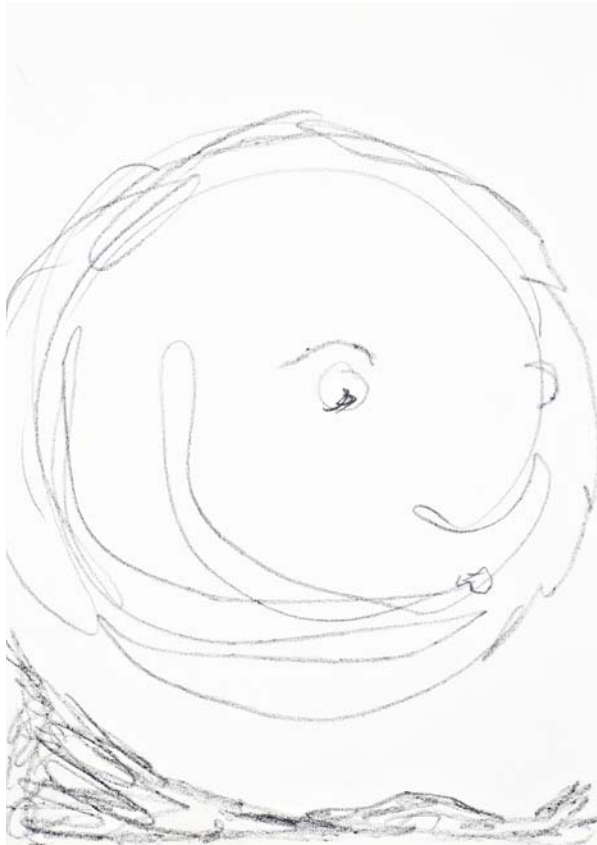
Selbst , 2012 Bleistift auf Papier, 42 x 29,6 cm