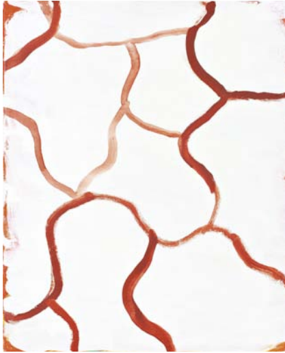
Ohne Titel , 2012 Öl auf Leinwand, 48,3 x 39,5 cm