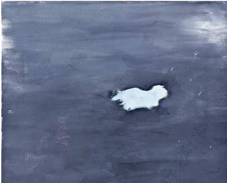
Blauer Hund, 2012