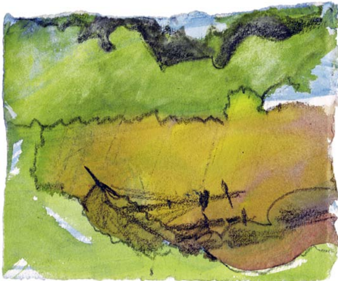
Ohne Titel , 2010/2011 Aquarell und Fettstift auf Papier, 13,6 x 16,8 cm