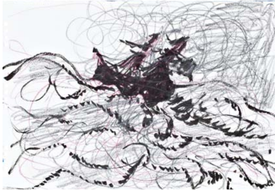
Ohne Titel , 2010/2011 Bleistift und Farbstift auf Papier, 24 x 34 cm