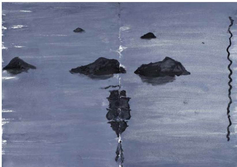
Aus dem Heft Übers Eismeer , 2010/2011 Aquarell und Tusche auf Papier, Doppelseite, 38 x 54 cm