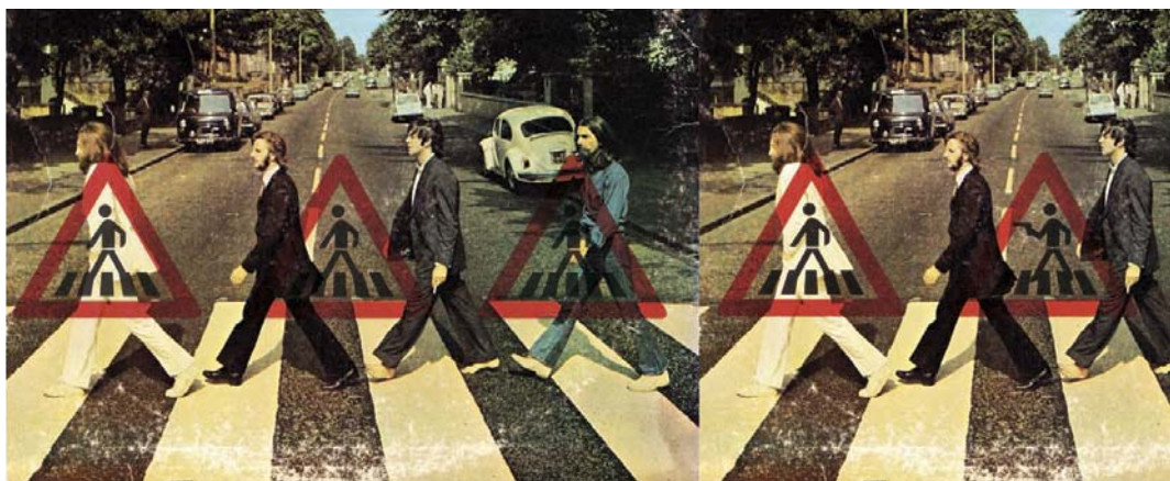
Bang, Bang , 2010. Inkjet Print, zehn Farben, auf Hahnemühle Fine Art Photo Rag Papier. Auflage: 3, 1 E.A., signiert, datiert, nummeriert, j