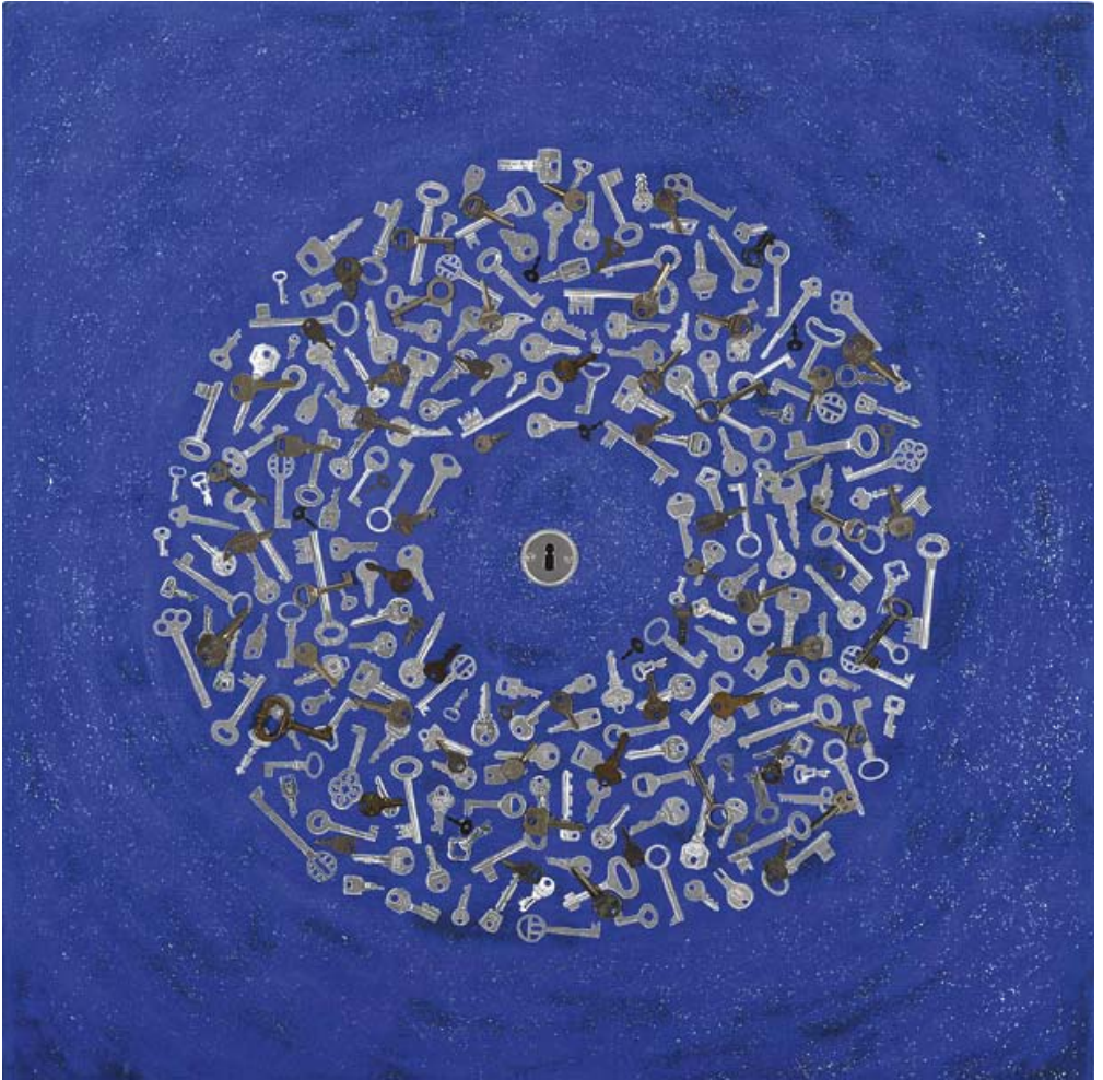
The Key (to My Heart) Gone Forever , 1989-2008 Mischtechnik auf Leinwand über Holzplatte, 95 x 95 cm