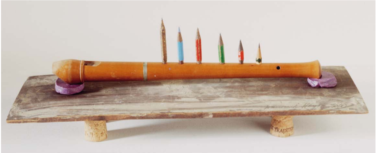
Mauthners Flöte , 2000. Blockflöte, Bleistifte, Plastilin, Sektkorken, 15 x 41 x 13,5 cm