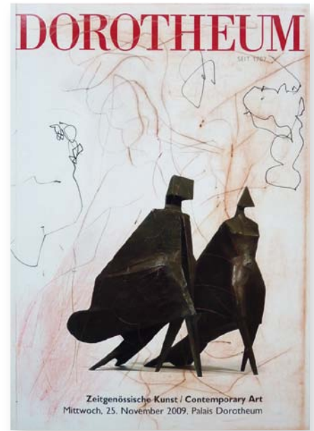
ART COMPLETE , 2011. Mischtechnische Bearbeitung von Auktionskatalogen