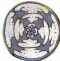
Gyrotaters , Since 1999, mixed media on paper, cardboard or wood