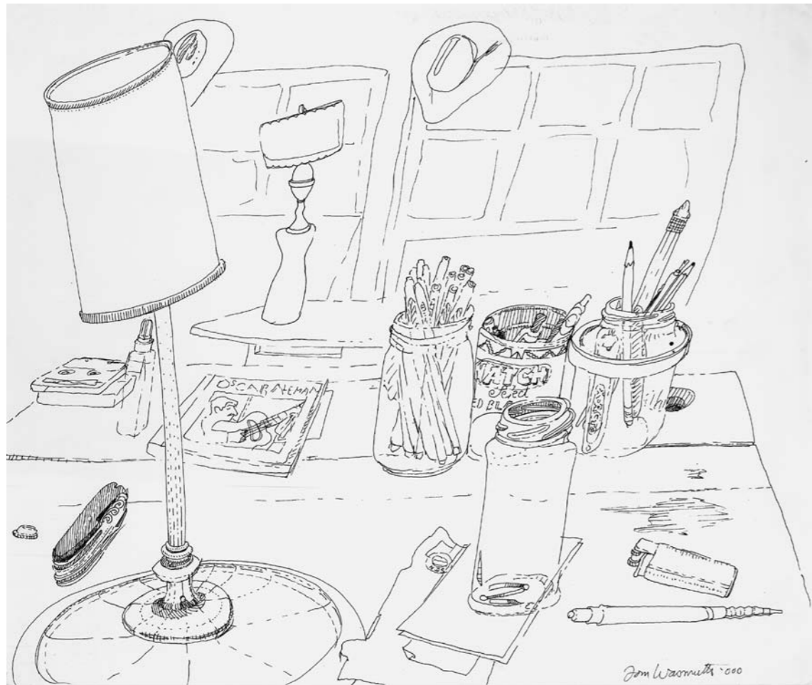
In Marshall Bodean's Albuquerque Office , 2000, ink on paper, 35,5 x 43 cm