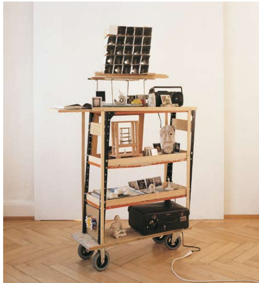
Wagon Number One: The Loaded Trolley , 1995, object