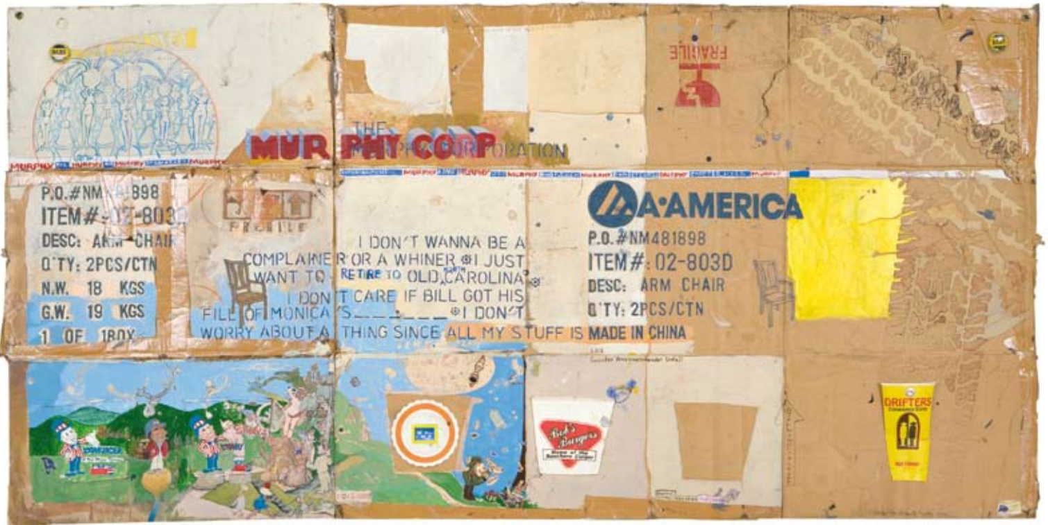
The Bob's Burgers, 2000 – 2002, mixed media on cardboard, 77 x 155 cm