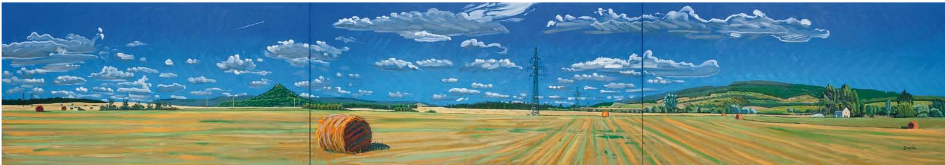
Panorama alte Eisenhammermühle II , 2008, Öl auf Leinwand, 80 x 460 cm