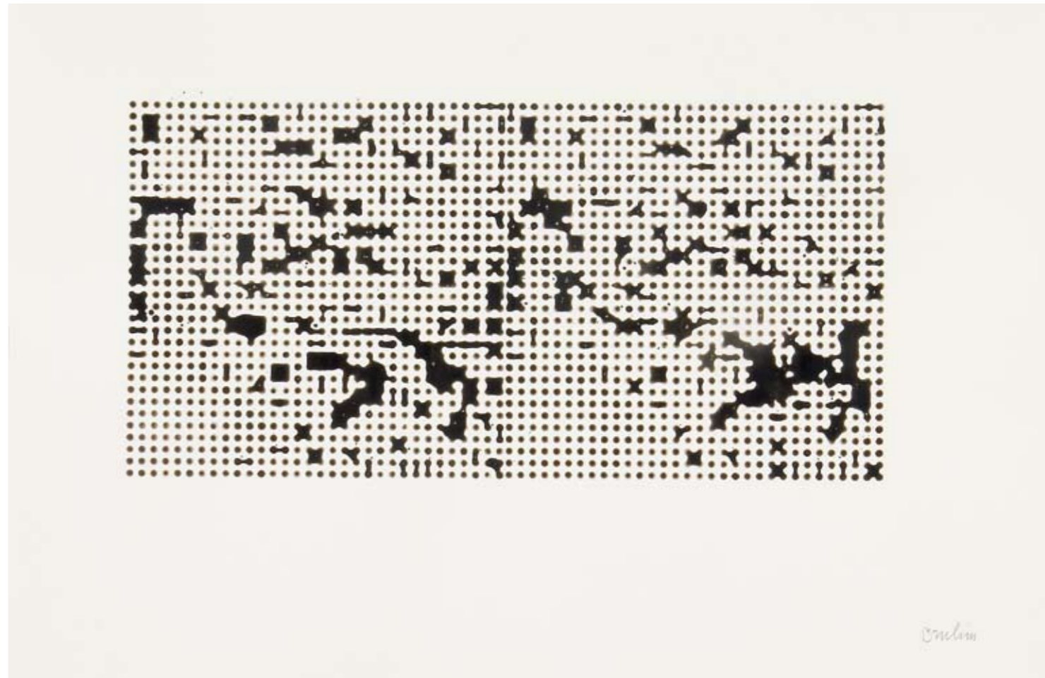
Ohne Titel , 2001, Monotypie, Acryl auf Papier, 50 x 70 cm