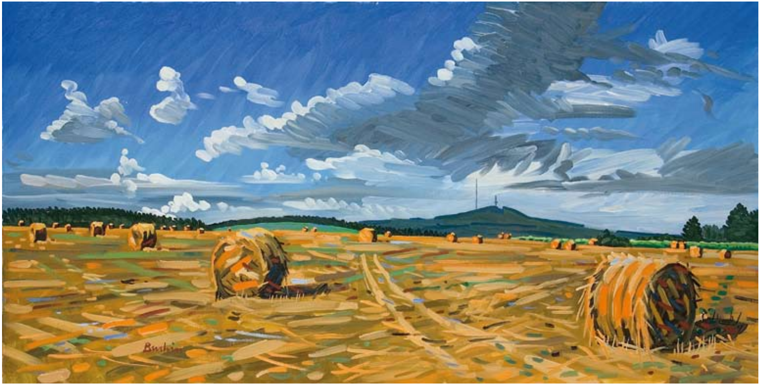
Strohballen, Kab-hegy III , 2008, Öl auf Leinwand, 80 x 160 cm