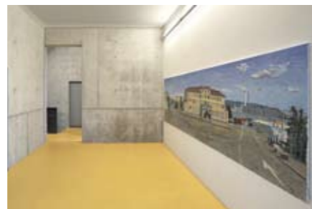
Anton Bruhin, Güterbahnhof Zürich Öl auf Leinwand, 130 x 450 cm

Im Beisein des Architekten Max Keller folgt in der Nähe die Besichtigung des Panoramas Güterbahnhof Zürich , das Anton Bruhin 2008 im Auftrag als Kunst am Bau realisierte. Loft 1, Erismanstrasse 2, 8004 Zürich