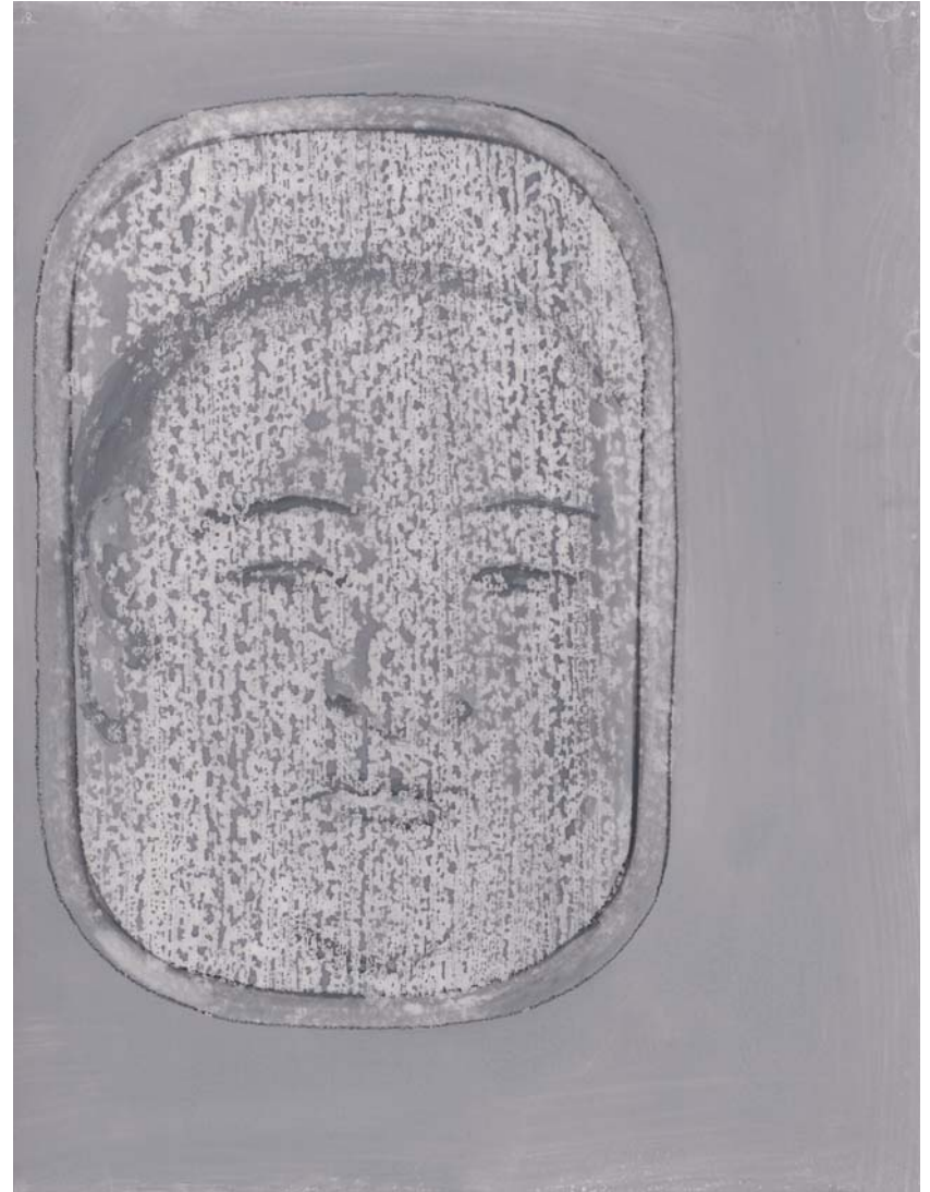
Aus Werkzyklus Flugzeugfenster , 2005 Gouache und Fettcreide auf Wachspapier, 32,5 x 25 cm