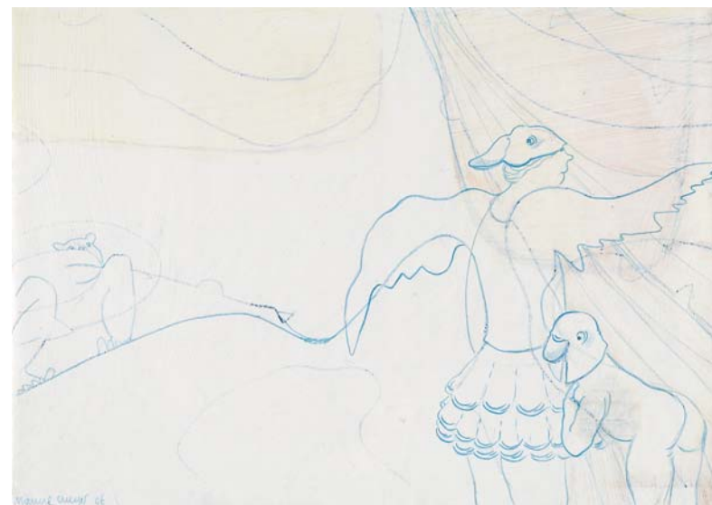
Aus Werkzyklus Ikarus Schwester , 2006 Farbstift und Dispersionsfarbe auf Papier, 21 x 29,7 cm

Galerie & Edition Marlene Frei · Zwinglistrasse 36 (Hof) · CH-8004 Zürich Tel: +41 (0)44 291 20 43 | Fax: +41 (0)44 291 20 62 | www.marlenefrei.com Öffnungszeiten: Mi–Fr 12.00–18.30 h, Sa 12.00–16.00 h oder auf Verabredung