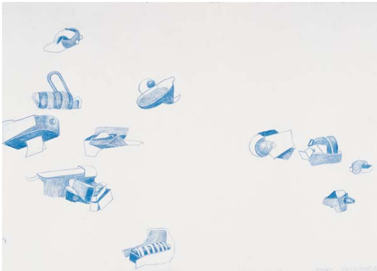
Aus Werkzyklus Himmeln , 2003 Farbstift auf Papier, 56,5 x 77 cm. Abb.: Katalog Kunsthalle Bremen, 2004, S. 70