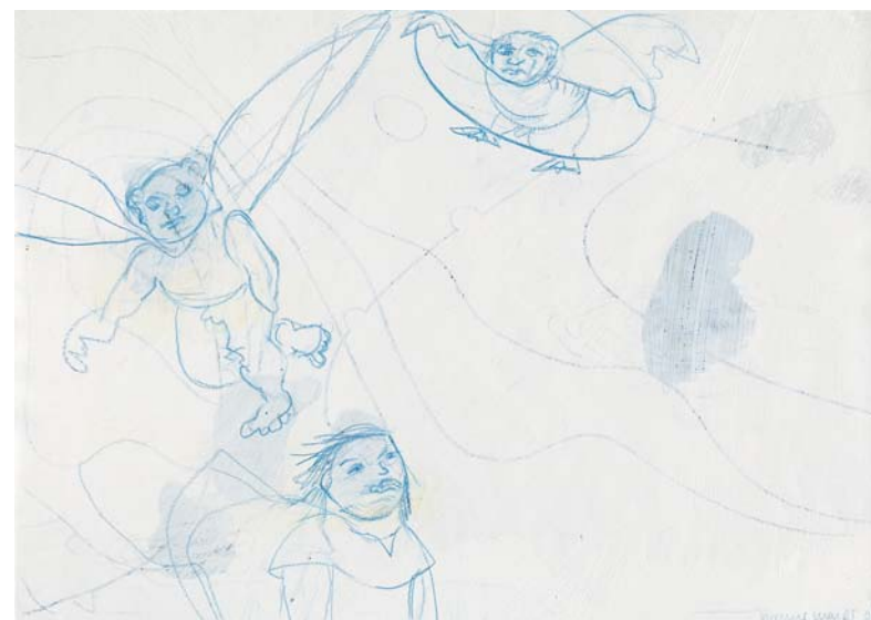
Aus Werkzyklus Ikarus Schwester , 2006 Farbstift und Dispersionsfarbe auf Papier, 21 x 29,7 cm