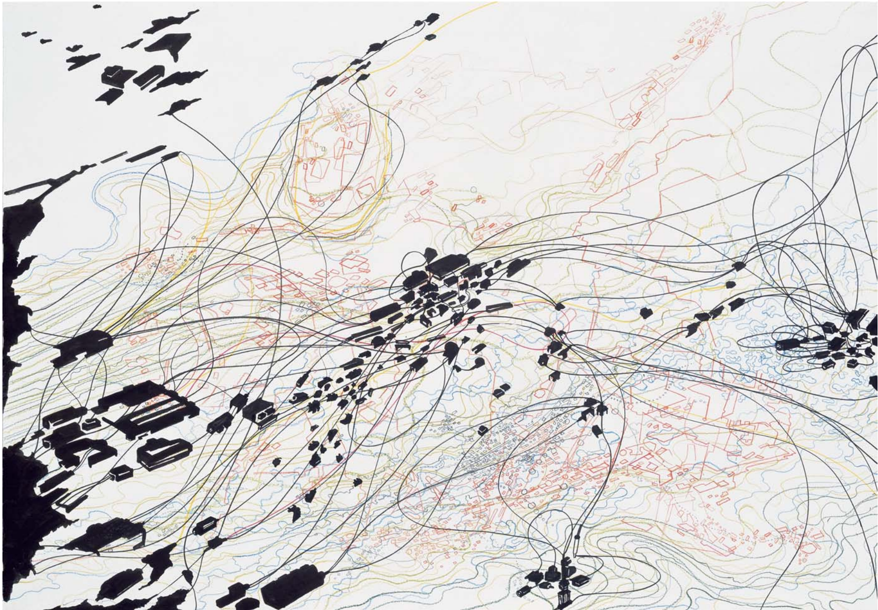
Luftblick vernetzt, 2005 Mischtechnik auf Papier, 48 x 66,5 cm