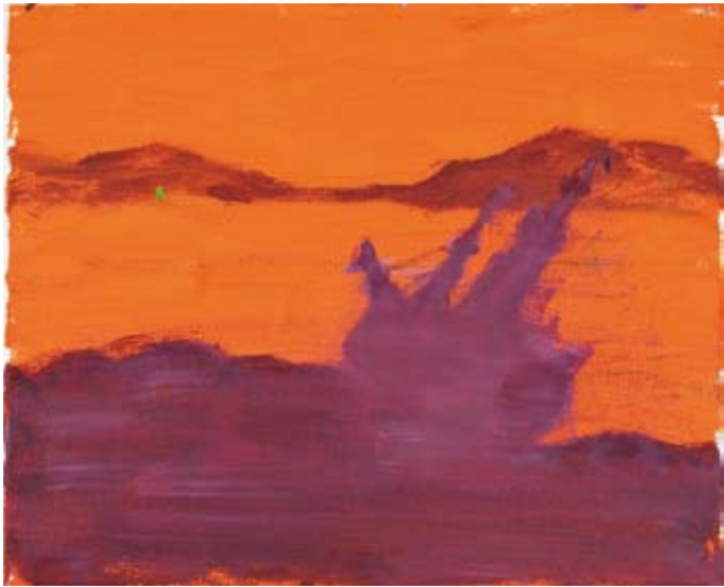
Ohne Titel , 2009 Eitempera und Öl auf Baumwolle, 39 x 48 cm