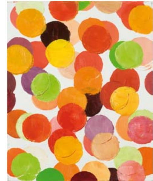
Ohne Titel , 2009 Öl auf Leinwand, 48 x 39 cm