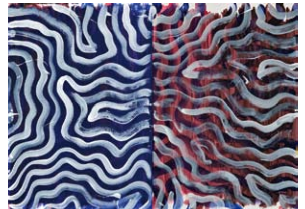
Aus den Heften Ohne Titel , 2008 Gouache auf Papier, Doppelseiten: je 53,8 x 76,4 / 38,2 x 54,4 cm