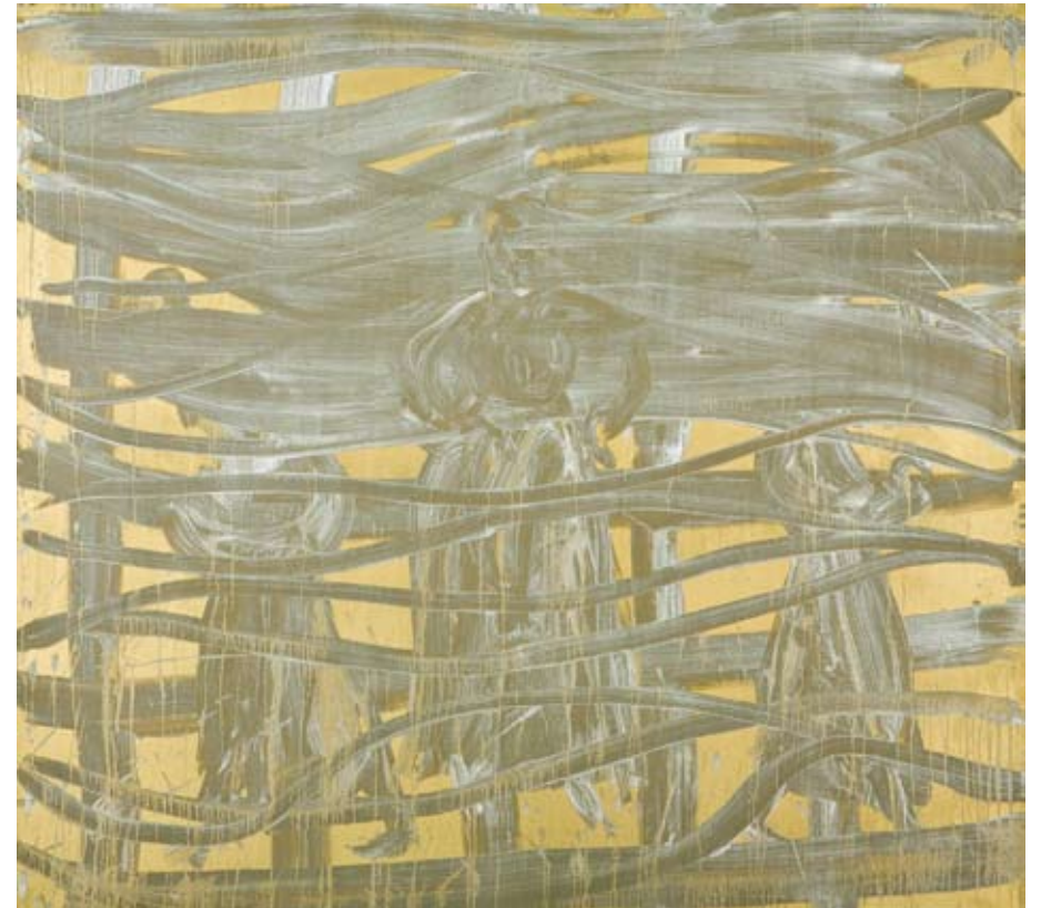
Madonna , 2009 Acryl auf Leinwand, 180 x 200 cm