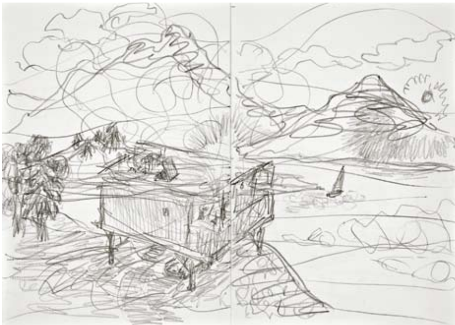
Aus dem Heft Selbst , 2009 Bleistift auf Papier, Doppelseiten: je 53,8 x 76,4 cm