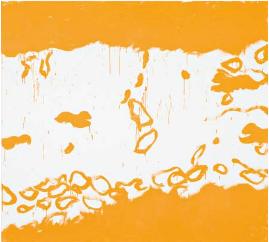
Voie lactée , 2003