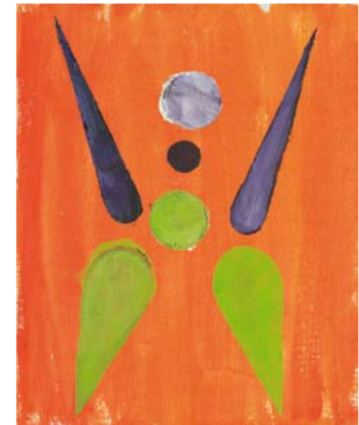
Ohne Titel (gefallene Engel) , 2008 Öl auf Leinwand, 48 x 39 cm